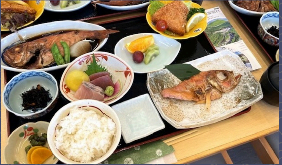
遥のぜいたく御膳 3,800円