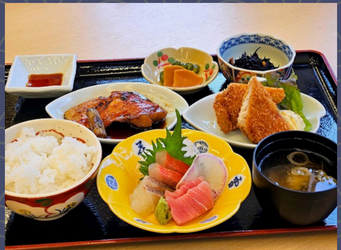
金目煮つけ御膳 2,500円