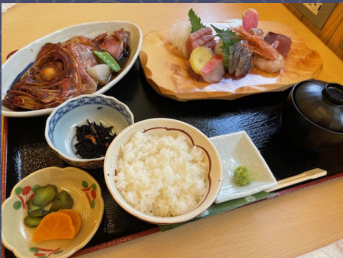
日替わりお造り御膳 2,380円