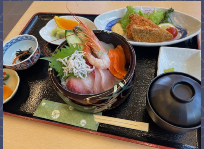
海鮮丼と魚フライ御膳 2,500円